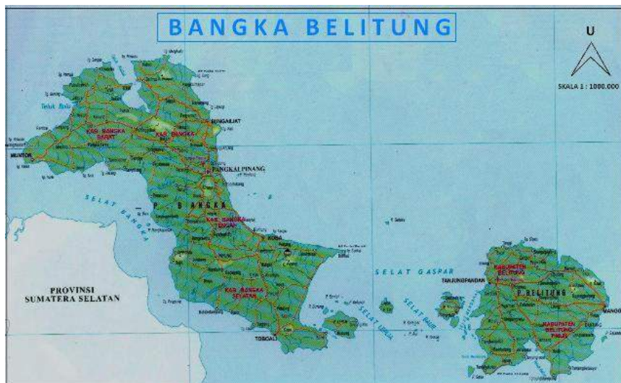
Gambar 1.5 Peta Provinsi Kepulauan Bangka Belitung

Wilayah Provinsi Kepulauan Bangka Belitung memiliki luas 18.725,14 km 2 , dimana sebagian besar merupakan wilayah perairan mencapai 79,90%.