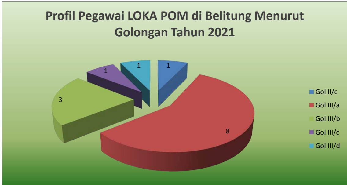
Gambar 1.4. Profil Pegawai LOKA POM di Belitung berdasar Golongan Tahun 2021