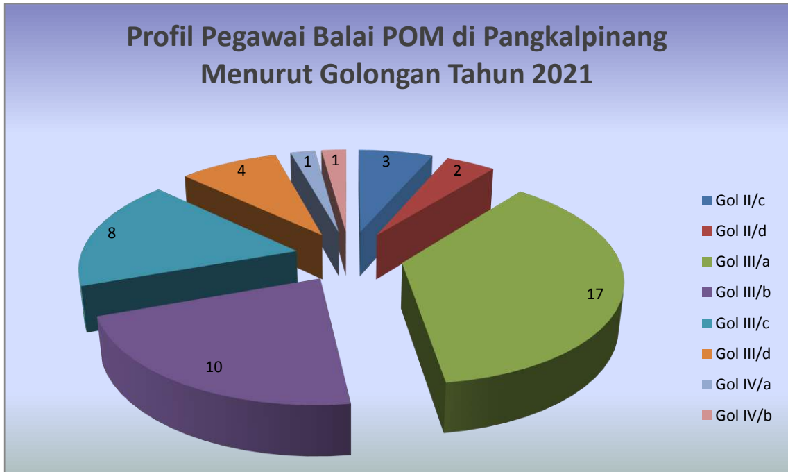
Gambar 1.3. Profil Pegawai Balai POM di Pangkalpinang berdasar Golongan Tahun 2021