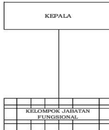
Gambar 1.2 Struktur Organisasi Loka POM di Kabupaten Belitung